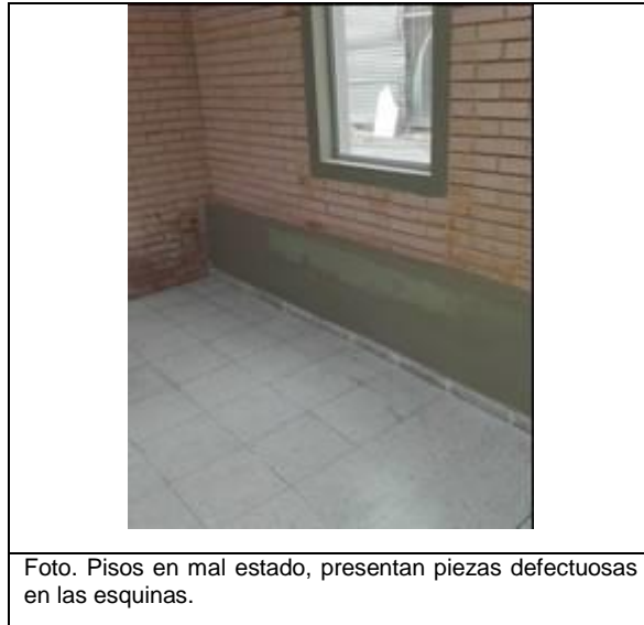
Foto. Pisos en mal estado, presentan piezas defectuosas en las esquinas.