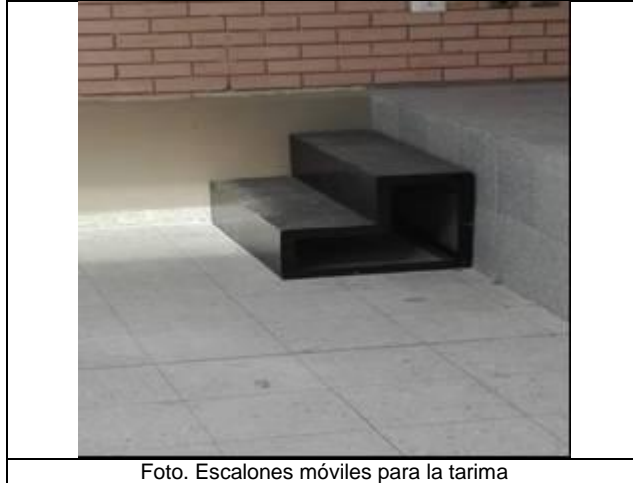
Foto. Escalones móviles para la tarima